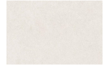
o similar / or similar Hormigón desactivado Deactivated concrete