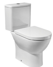
o similar / or similar Inodoro Toilet