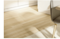
o similar / or similar Porcelanato imitación madera Wood effect ceramic tile