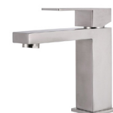
o similar / or similar Grifería Faucets