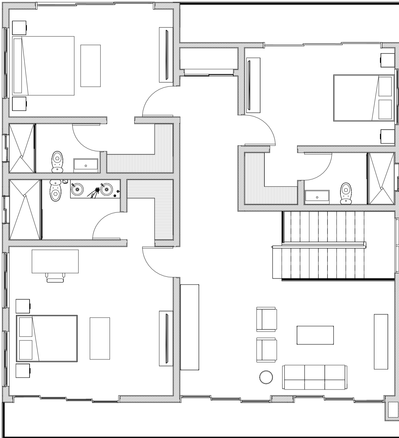
1 Planta Arquitectonica - Nivel 2 1:75

NOTA: PARA MÁS INFORMACIÓN POR FAVOR CONTACTAR CON UN REPRESENTANTE.